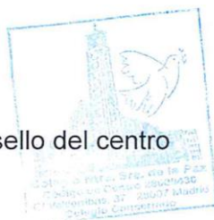
sello del centro