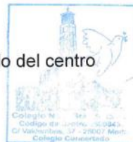
Sello del centro